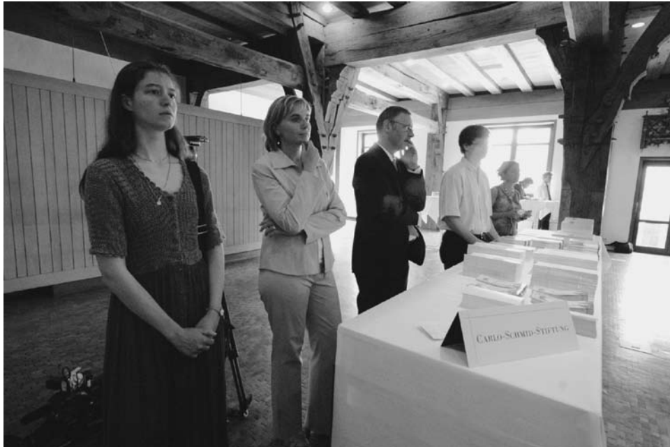
Die Organisatoren der Preisverleihung der Stadt Tübingen und der Carlo-Schmid-Stiftung verfolgen gespannt die Reden.