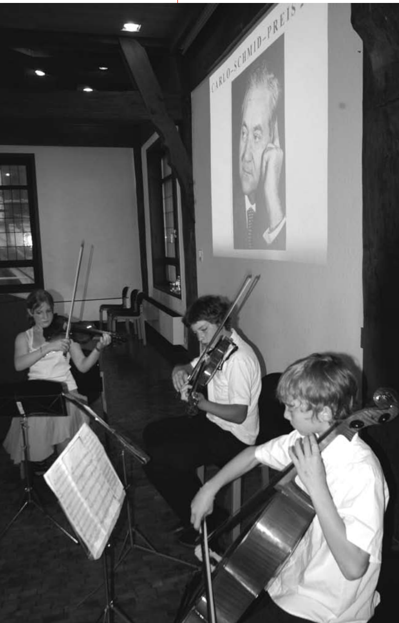
Musikalische Umrahmung durch die Musikschule Tübingen

Wir freuen uns, den 9. Carlo-Schmid-Preis „an Personen oder Organisationen verleihen zu können, die durch ihr Lebenswerk, Publikation oder Aktion einen Beitrag zur Erhaltung und Weiterentwicklung des demokratischen Rechtsstaates, der politischen Kultur sowie der europäischen Verständigung im Sinne der liberal-humanistischen Tradition Carlo Schmid’s“ geleistet haben. So steht es in unserer Satzung. Den Carlo-Schmid-Preis haben schon außergewöhnliche Persönlichkeiten wie Helmut Schmidt, Jacques Delors, Daniel Goeudevert und Lilli Gruber oder besondere Institutionen wie der Fernsehsender ARTE und das deutsch-französische und das deutsch-polnische Jugendwerk erhalten.