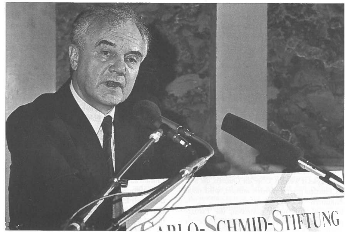
Preisträger: Ministerpräsident Dr. Manfred Stolpe

Wenn alles gut geht, werden Brandenburg und die anderen ostdeutschen Länder nach Bewältigung der gegenwärtigen Struktur- und Anpassungskrise unserer Wirtschaft die modernste Industrie haben, ebenso wie uns die Deutsche Bundespost Telecom das modernste Telekommunikationssystem verspricht. Wir streben auch an, eine moderne, heutigen Aufgaben und Herausforderungen entsprechende Landesver-