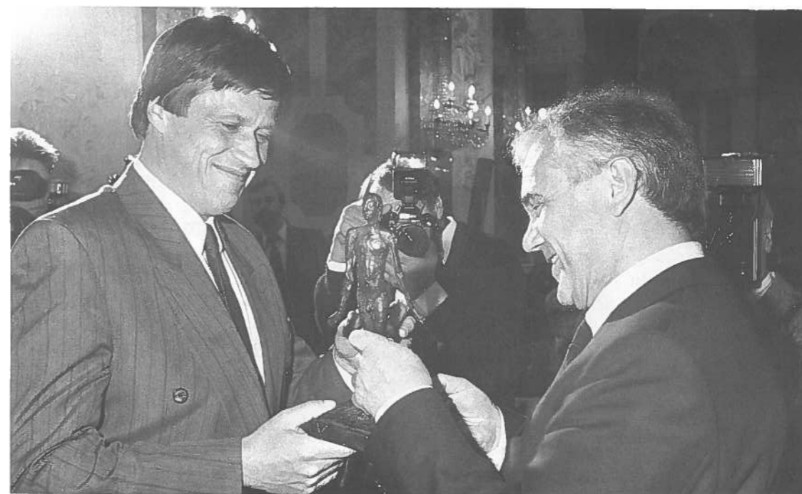
Preisübergabe: Ulrich Maurer übergibt Dr. Manfred Stolpe den Carlo-Schmid-Preis

Möge Ihnen diese Auszeichnung, die Erinnerung an Carlo Schmid, helfen, die Kraft zu finden, den Ihnen im besonderen Maße anvertrauten Menschen zu helfen. Wir wünschen Ihnen die Kraft, daß Sie uns in der Ihnen eigenen Art weiterhin ein gutes Beispiel geben für die politische Kultur in unserem Lande. Wir wünschen Ihnen die Kraft, Ihren besonderen Beitrag zu leisten, damit wir alle möglichst bald gemeinsam sagen können: „Wir sind ein Volk in einem großen vereinigten Europa, das sich seiner Verantwortung in der Welt bewußt ist.“