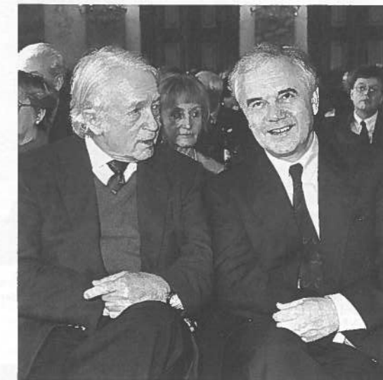
Preisträger: Klaus von Bismarck und Dr. Manfred Stolpe

Nach der Nazi-Herrschaft wurde Carlo Schmid 1946 Ordentlicher Professor für Völkerrecht in Tübingen und 1953 Professor für politische Wissenschaften an der Universität Frankfurt. Am 25. Mai 1945 trat in Tübingen ein vorläufiger Gemeinderat zu seiner konstituierenden Sitzung zusammen und wählte Carlo Schmid zum Vorsitzenden. Am 5. Dezember 1946 wurde Carlo