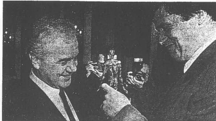
Eine Plastik des Berliner Bildhauers Hans Scheib überreichte Baden-Württembergs SPD-Chef Uli Maurer (rechts) dem Carlo-Schmid-Preisträger Manfred Stolpe am Wochenende in Mannheim.

Mannheim. (mn - Eigener Bericht) Die Verleihung des Carlo-Schmid-Preises an ihn hat der brandenburgische Ministerpräsident Manfred Stolpe zu einem Aufbruch für eine „aktive Einwanderungspolitik“ genutzt. „Politiker sollten bewußt auf den Satz verzichten: Deutschland ist kein Einwanderungsland“, sagte Stolpe am Wochenende in Mannheim. Der SPD-Politiker forderte, sich auf einen „kräftigen Zustrom von Menschen“ einzustellen. Dies müsse die Politik öffentlich vertreten, um einer gefährlichen Verweigerungshaltung der Bürger entgegenzuwirken, sagte er mit Blick auf die zunehmende Gewalt gegen Asylbewerber. Den mit 10 000 Mark dotierten Preis, den die Carlo-Schmid-Stiftung verleiht, erhielt Stolpe auch für seinen Verdienst um die friedliche Revolution in der DDR (Bericht S. 2).