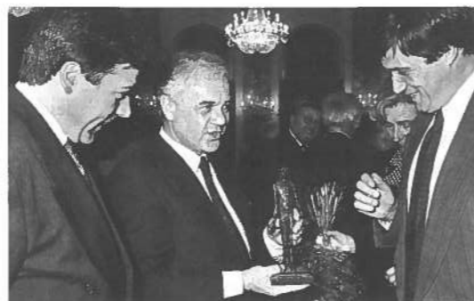
Im Gespräch: Siegmur Mosdorf, Dr. Manfred Stolpe und Ulrich Maurer

über Ihre heutige Auszeichnung mit dem Preis der Carlo-Schmid-Stiftung freue ich mich von Herzen. Als Anwalt der Menschen verwirklichten Sie in den Jahren der Teilung den Auftrag der Kirche, Orientierung und Schutz zu gewähren. Ihre stets in praktizierter Mitmenschlichkeit offenbarte Integrität machte Sie Deutschen in Ost und West zum glaubwürdigen und verlässlichen Gesprächspartner. Daraufhin haben die Brandenburger Sie zu ihrem ersten Landesvater gewählt, und die vielfältigen, kritisch-konstruktiven Gedanken, die wir von Ihnen empfangen, bekräftigen Ihre Wahl. Einen Hüter humanen Denkens und Handelns der ehemaligen DDR im vereinten Deutschland zu ehren, entspricht unserem tiefen Empfinden. So knüpfe ich an den heutigen Tag auch die Hoffnung, daß die besonnenen und streitbaren Bürger, die wie Sie so nachdrücklich für die Menschenrechte kämpfen, in Ihrer Auszeichnung unseren Dank und unsere Achtung erkennen.