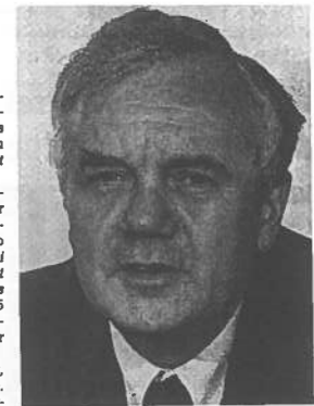
MANFRED STOLPE – ein Hoffnungsträger politischer Kultur

1990 trat Stolpe der neugegründeten SPD bei, wurde ihr Spitzenkandidat bei den Landtagswahlen im neuen Land Brandenburg und fuhr den einzigen SPD-Sieg in Ostdeutschland ein. Seit Ende 1990 regiert er mit einer Ampelkoalition aus SPD, FDP und Grünen. In dieser Zeit,