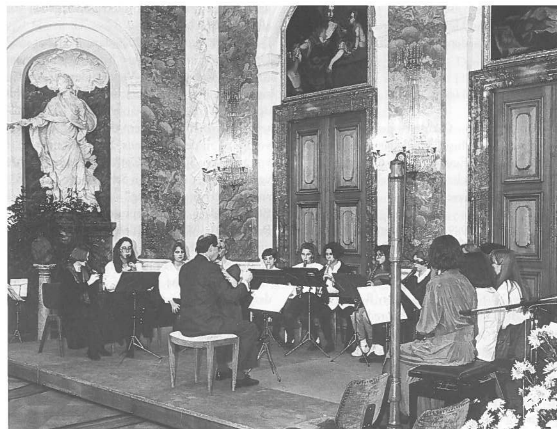
Das Flötenensemble der Carlo-Schmid-Schule, Tübingen

Dr. Manfred Stolpe, MdL Ministerpräsident des Landes Brandenburg