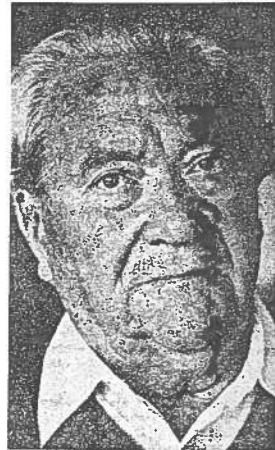
Humanist und homme de lettres: Carlo Schmid wäre heute 95 Jahre alt geworden.

Der ehemalige Mannheimer SPD-Bundestagsabgeordnete und Verfassungsrechtler wäre jetzt 95 Jahre alt