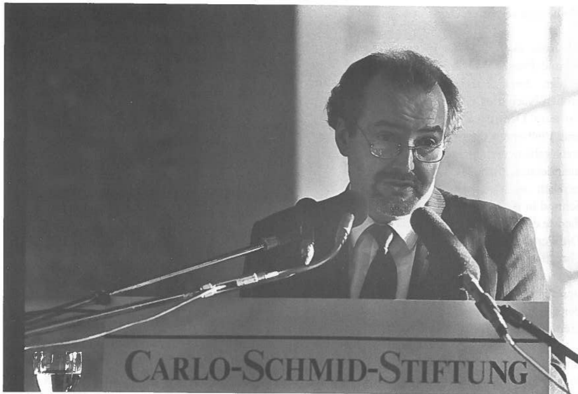
Oberbürgermeister Gerhard Widder

der sogenannten „alten“ Bundesrepublik große Hoffnungen für jenen Prozeß der Schaffung einer umfassenden Einheit. Kurt Schumacher führte in seiner letzten öffentlichen Rede aus: „Die Vereinigung Deutschlands kann nur erfolgen durch gemeinsame Anstrengung und gemeinsame Übernahme des Risikos für alle Teile Deutschlands“. Er warnte, den Menschen im Osten jene menschliche Solidarität zu verweigern, „auf die sie einen Anspruch haben“. Solidarität, die Sie, Herr Ministerpräsident, mit Recht auf allen Ebenen einfordern und die häufig leider nur allzu zaghaft bewiesen wird. Hier sind wir alle gefordert, unseren individuell möglichen Beitrag zu leisten, damit die innere Einheit gelingt.