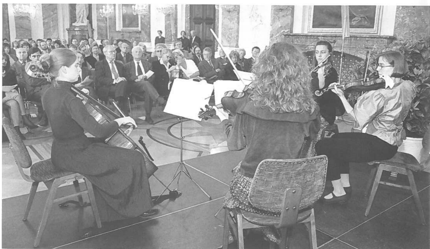
Studentinnen der Staatlichen Hochschule für Musik Heidelberg/Mannheim gestalten den musikalischen Part