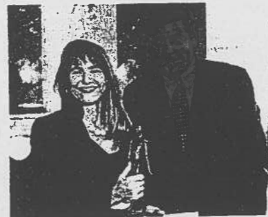
Journalistin Lilli Gruber erhält Carlo-Schmid-Preis