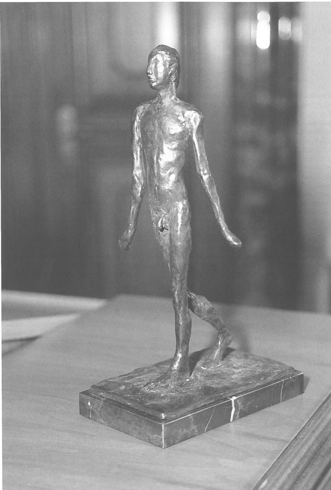
Die Statue symbolisiert den humanen Fortschritt. Sie wurde von dem Berliner Künstler Hans Scheib im Auftrag der Stiftung in limitierter Auflage gefertigt und wird den Preisträgern jeweils bei der Verleihung überreicht.