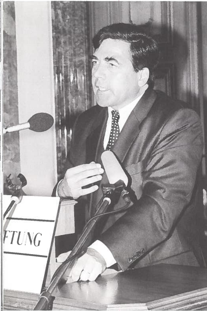
Siegmar Mosdorf MdB, Vorsitzender des Vorstands