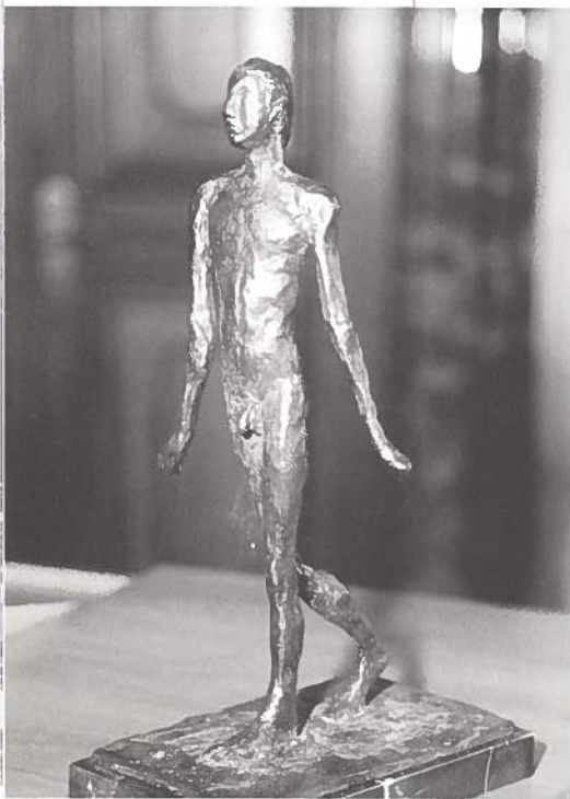
Die kleine Statue des Berliner Künstlers, Hans Scheib, ist Bestandteil des Preises. Sie symbolisiert den humanen Fortschritt.

Der Carlo würde an das Verantwortungsbewußtsein der Deutschen appellieren und an die Tugenden. Seine Bildung würde ihn die Klugheit, das Maß, die Gerechtigkeit und die Tapferkeit, die vier Kardinaltugenden des Thomas von Aquin zitieren lassen. Und sodann würde er von den bürgerlichen Tugenden sprechen, von der Hilfsbereitschaft, die wir von uns selber verlangen müssen, so von der Zuverlässigkeit, so von der Wahrheitsliebe, so zum Beispiel auch von der Toleranz. Toleranz aus Respekt vor den Über-