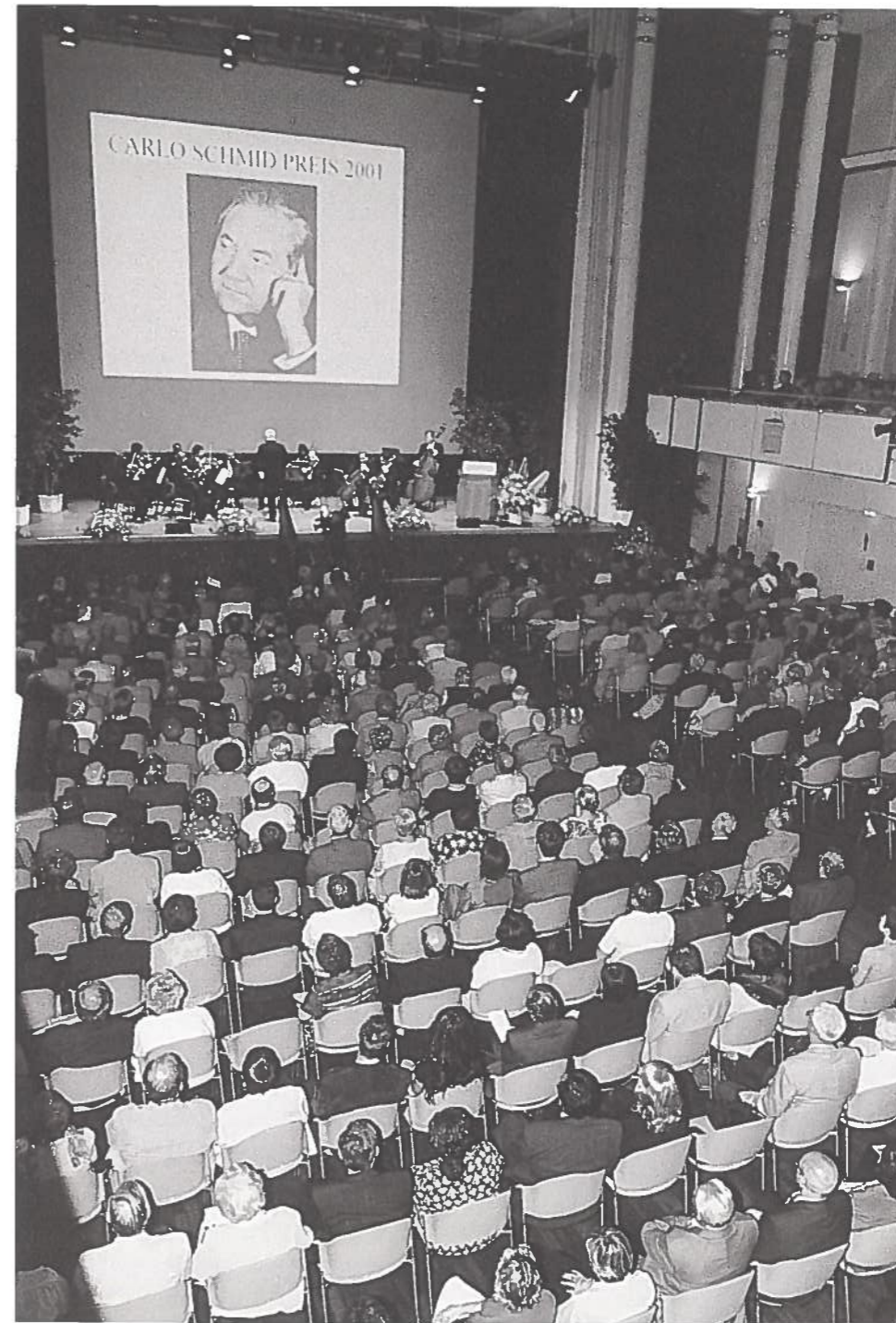
Mehr als 1000 Gäste kamen zur Preisverleihung in den Mannheimer Rosengarten.